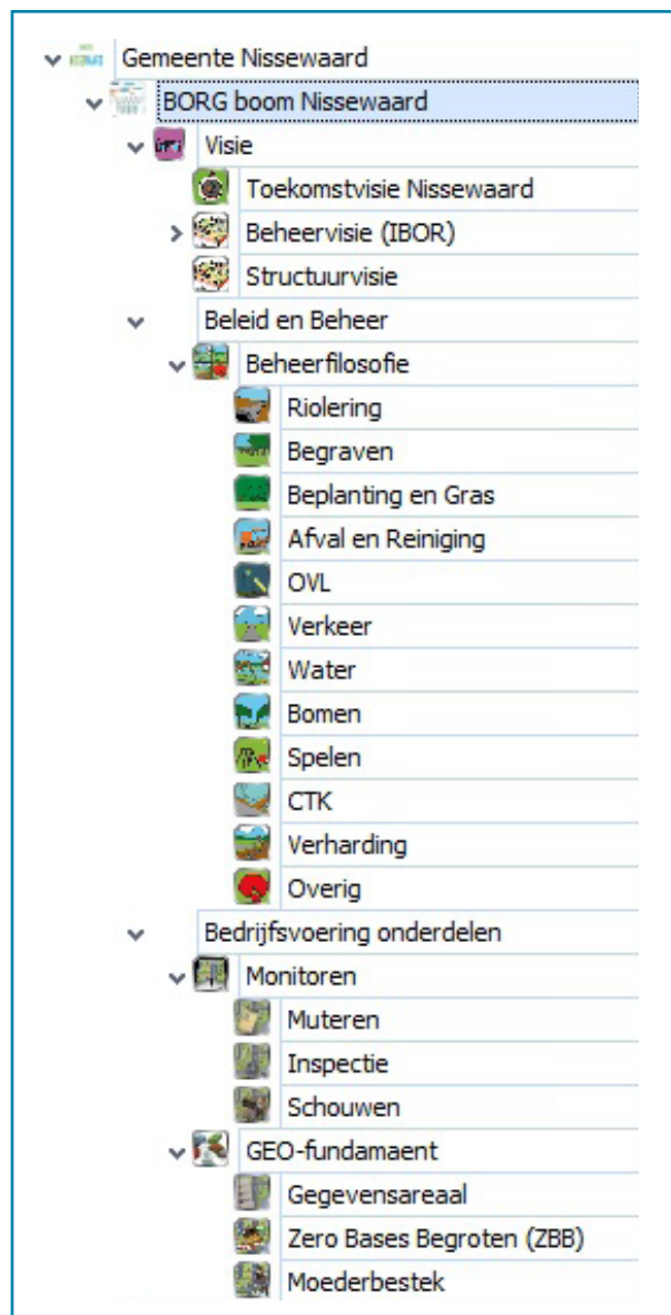
Schematisch voorbeeld van een "BORG boom" die gebruikt wordt binnen de add-on BORG-systematiek.